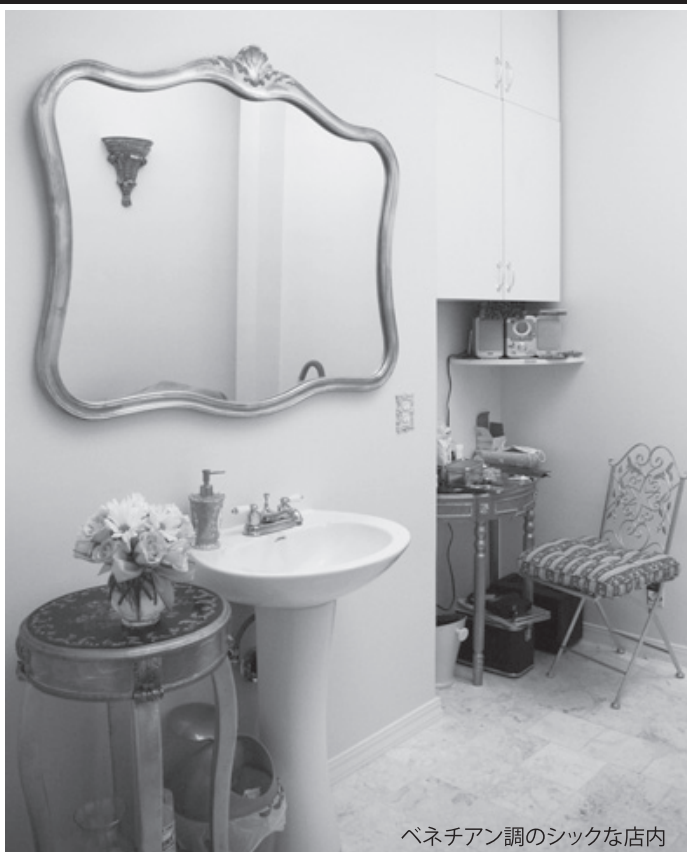
ベネチアン調のシックな店内

施術中は衛生面に対するこだわりも徹底的。前職はサージュカルアシスタントだったので衛生面の重要性はよくわかってはいるつもりです。そんな細かな心配りもうれしい!